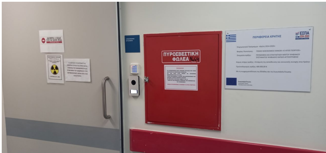
ΦΩΤΟ 2 ΕΙΣΟΔΟΣ ΑΙΜΟΔΥΝΑΜΙΚΟΥ ΤΜΗΜΑΤΟΣ