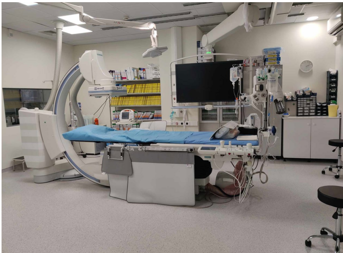
ΦΩΤΟ 4 ΕΣΩΤΕΡΙΚΟ ΜΟΝΑΔΑΣ ΚΑΡΔΙΟ ΑΓΓΕΙΟΓΡΑΦΙΑΣ