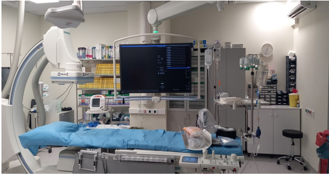
ΦΩΤΟ 3 ΣΥΣΤΗΜΑ ΚΑΡΔΙΟΑΓΓΕΙΟΓΡΑΦΙΑΣ