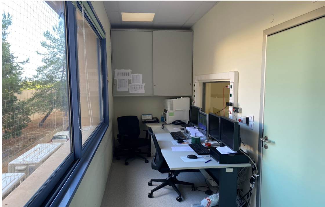
ΦΩΤΟ 5 CONTROL ROOM